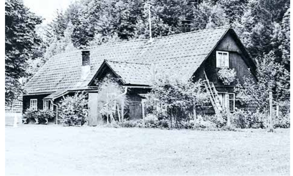
Unsere erste gemeinsame Wohnung war in diesem Haus.