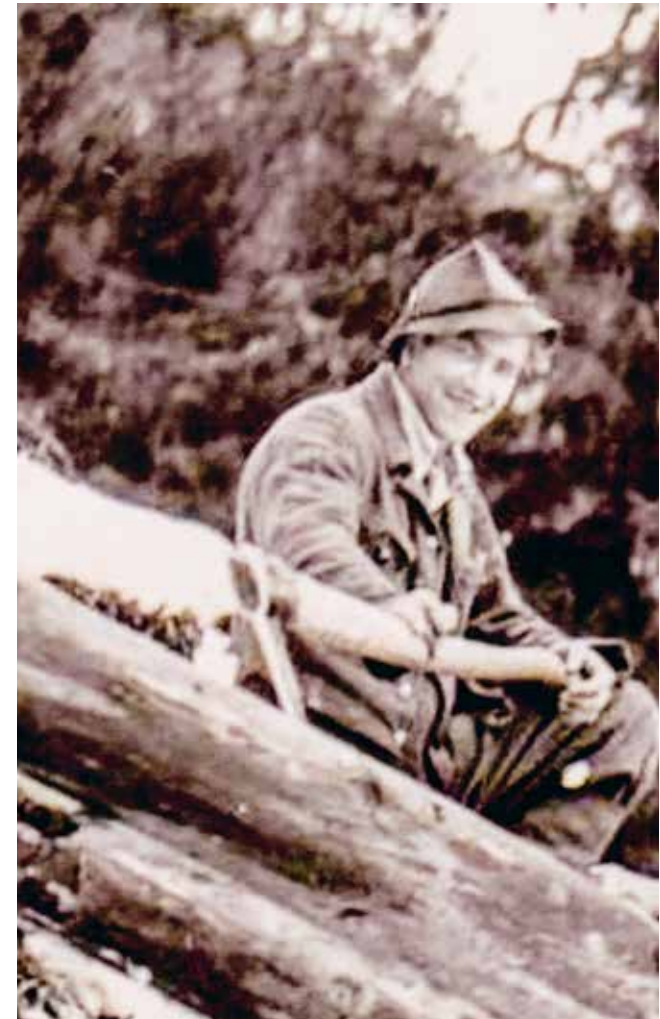
Im Jänner 1952 am Hochkogel

Sollte ich noch einmal auf die Welt kommen, werde ich wieder Holzknecht.