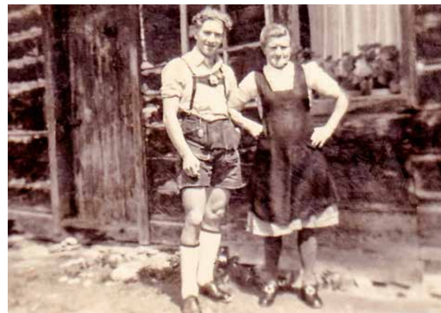
Im Jahr 1948 in Brunnbach mit meiner Mama vor meiner ersten Bleibe

Kennengelernt habe ich sie ja schon zu meiner Schulzeit in der Brunnbachschule. Aber da hatte ich noch keine Zeit für sie. Ich hatte da ja nur „Flausen“ im Kopf. Musste den Herrn Dechant und meinen Lehrer ärgern und gegen Ende meiner Schulzeit interessierte mich nur meine Menau . Kein Wunder, dass ich da noch keine Zeit für sie gehabt habe. Wird ihr aber wahrscheinlich egal gewesen sein. Der Schönste war ich bis dahin ja auch noch nicht. Geändert hat sich das im Mai 1948 als ich mich als Neunzehnjähriger bei den Bundesforsten bewarb und mich in Brunnbach sesshaft machte.