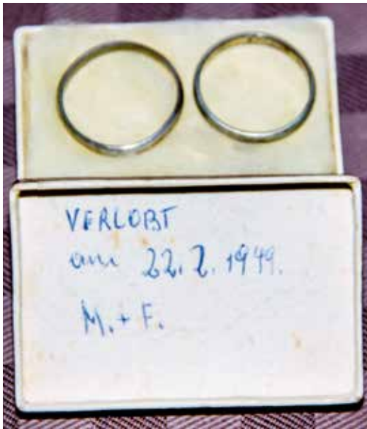
Im Deckel der Schatulle habe ich seinerzeit das Datum festgehalten.