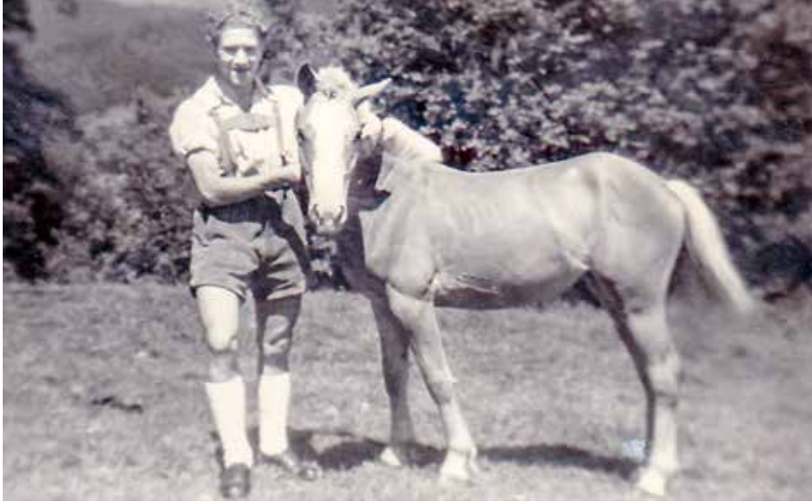
1950 im Rauchgraben

Meine Schwiegereltern, die Muata und der Våta haben die Lebenseinstellung, die sie selber praktiziert und an den Tag legten, ihren Töchtern immer gepredigt und mitgegeben: